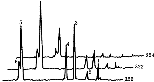
图3 3#土样三离子质谱图

图3是某含氯药厂周围不同方向的3#土样的 m/z 320、322、324三离子质谱图。